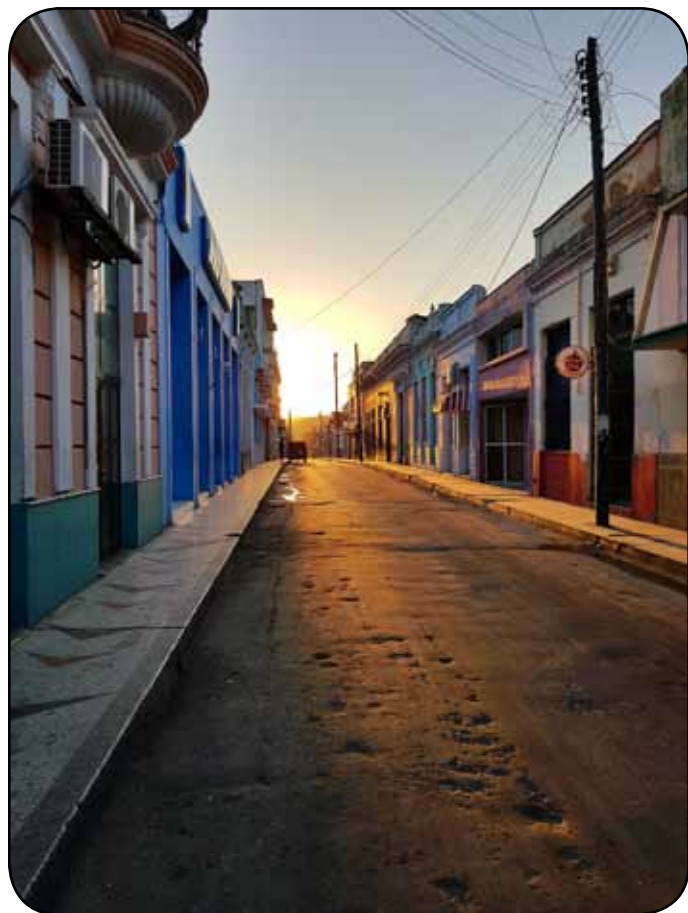
Ce n'est qu'un au revoir.