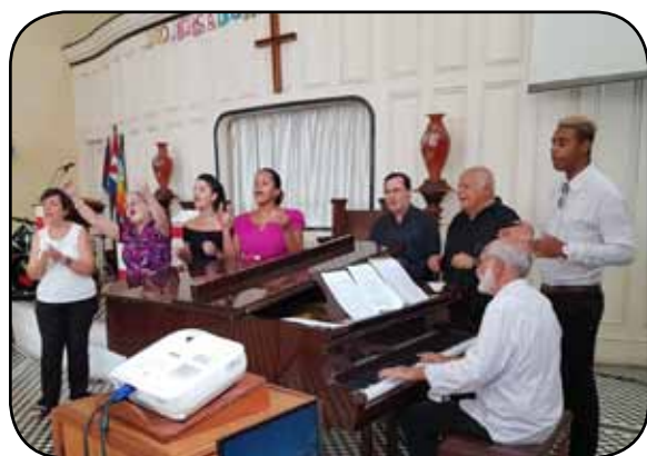
Le chœur de Kairós.