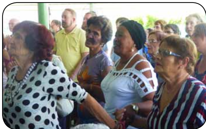
Unis pour le Suriname.