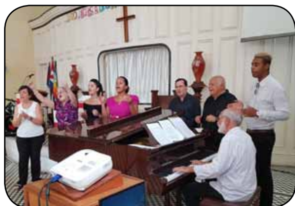
Le chœur de Kairós.